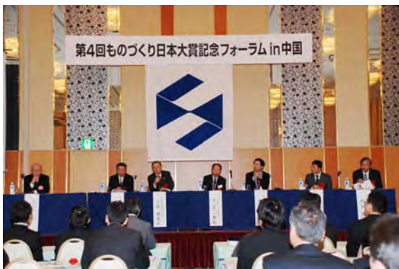
■ パネルディスカッション