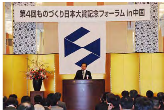
■ 中国経済産業局長 井辺國夫 挨拶