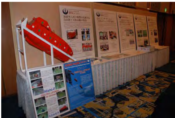
■ 受賞概要パネル及び製品等を会場に展示