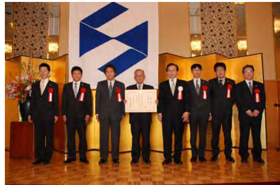
■ 中国経済産業局長賞 (株)木原製作所