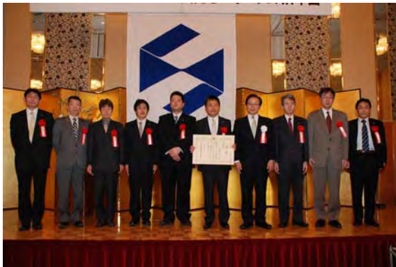
■ 優秀賞 安田工業(株)