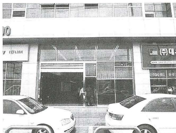
「小松コリア」工場正面

小松電機産業は、韓国ソウルに現地法人と工場を設立した。工場は韓国をはじめ、近隣のアジアなどに販売する高速シートシャッターの生産拠点として6月中旬に稼働を始める。現地法人「小松コリア」は今年5月に設立した。「小松コリア」は昨年5月に開設したソウル支社から順次、業務を移管、部材の調達や、新設した韓国工場で生産する高速シートシャッターの海外展開に向けた販売拠点に位置付ける。工場は2階建ての総面積約300m 2 。高速シートシャッターの製造や施工、メンテナンス業務を担う。小松コリア全体で本年度500台の生産販売を目指す。グローバル化にともなう世界展開のあり方として小松電機の小松昭夫社長が06年12月、「ガレージファクトリー構想」を発表、「最終ユーザーに近い場所での生産、アフターサービスの充実、200平方メートル程度の用地」での、世界多拠点生産について計画を進めてきた。今回「門番」新型の開発進捗にともない、韓国