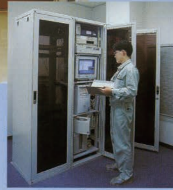
コンピュータ室/情報結び空間