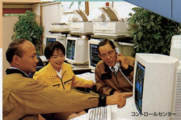
コントロールセンター