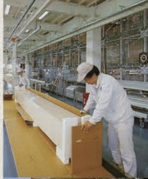
本社工場/創造具現化のステージ