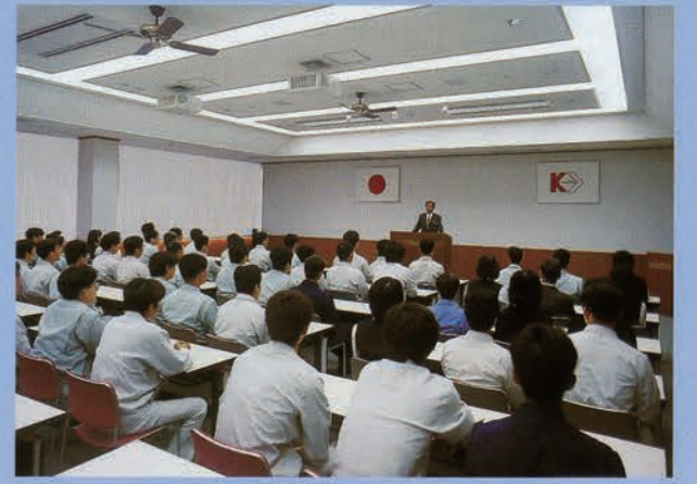
セミナーホール/心の進化を求めて