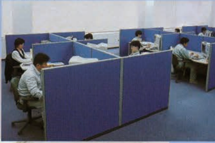
システム事業部 創造、構想の場