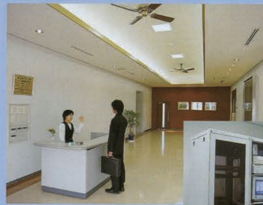
ロビー 出会いへの アプローチ