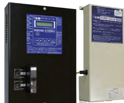
MA-SB + BU06

停電時、バッテリーユニットにより約6時間監視を継続します。(1分に1回の間欠監視モードの場合は24時間監視)