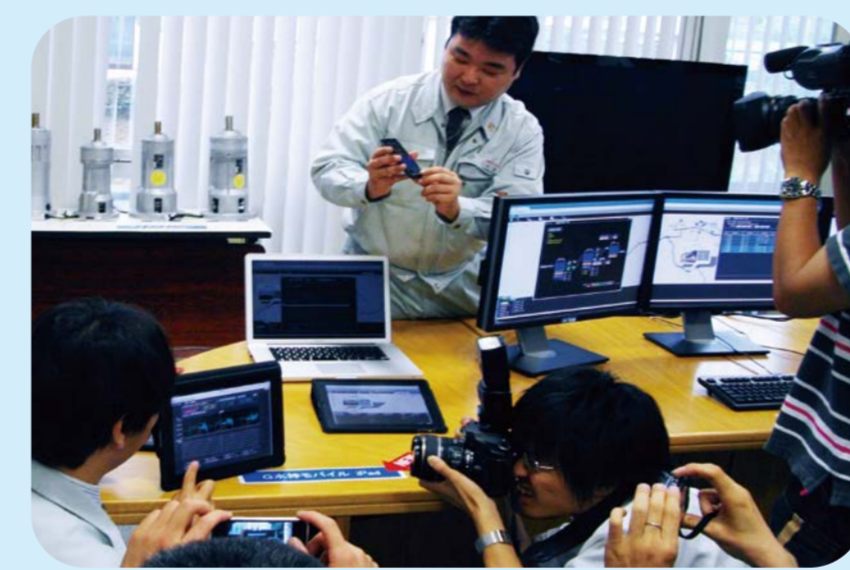
2010 水神Gシリーズ発表