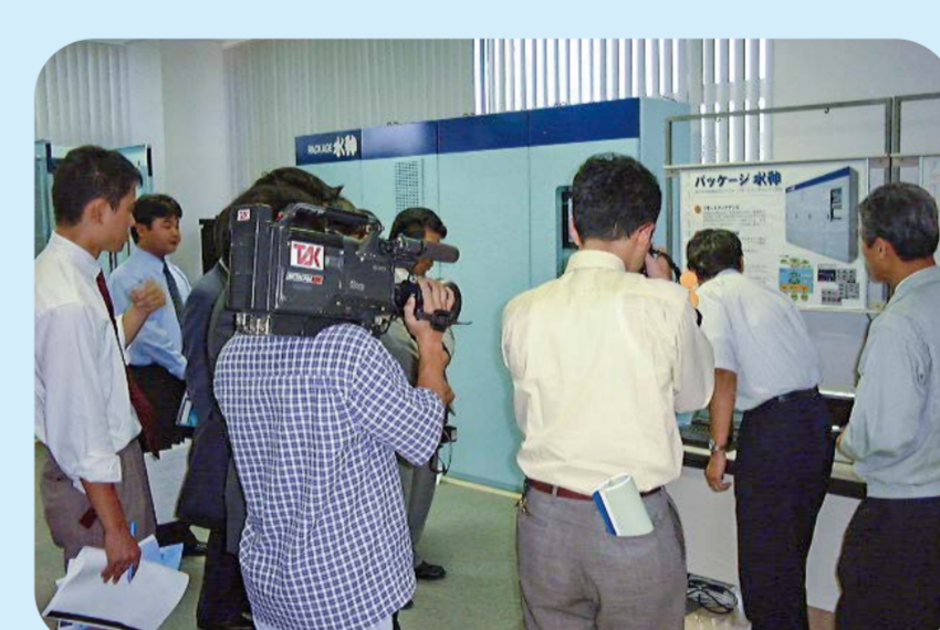
2000 水神ネットワーク発表