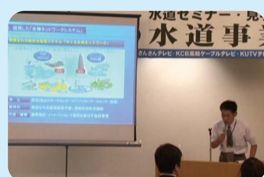
2009 高知県安芸市で水道セミナー開催