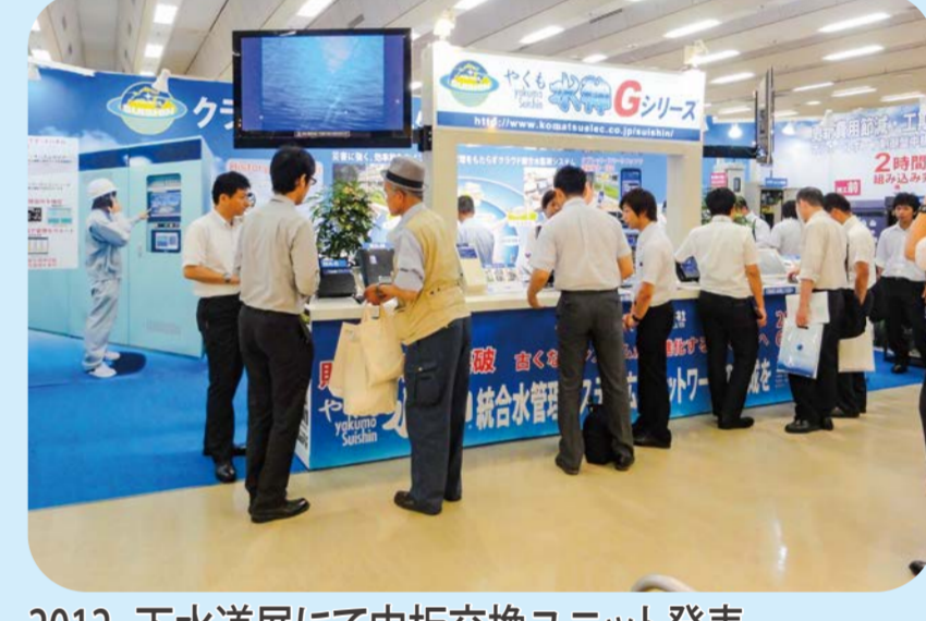
2012 下水道展にて中板交換ユニット発表