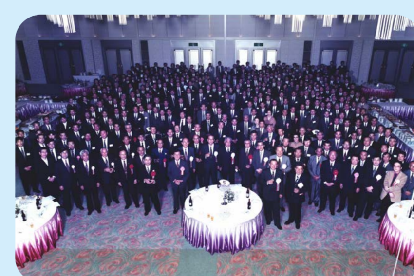
「水神」注目発明選定証受証記念祝賀会