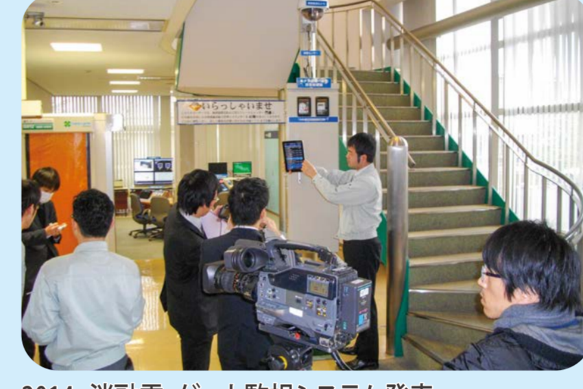
2014 消雪・ゲート監視システム発表