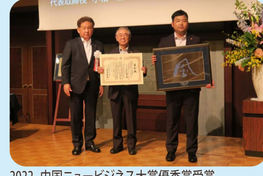
2022 中国ニュービジネス大賞優秀賞受賞