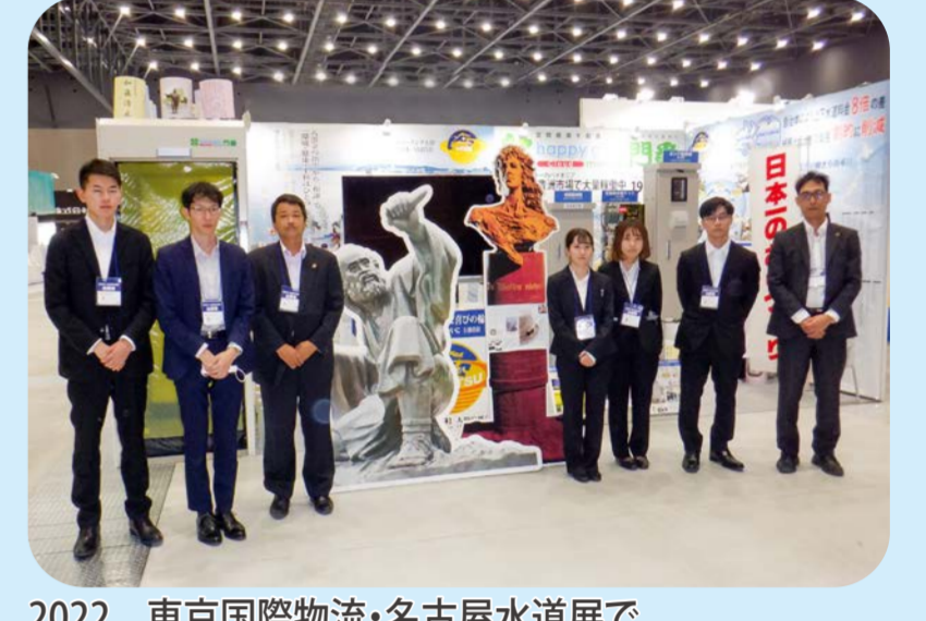
2022 東京国際物流・名古屋水道展で通信機能・手指消毒機能を有した新型を発表