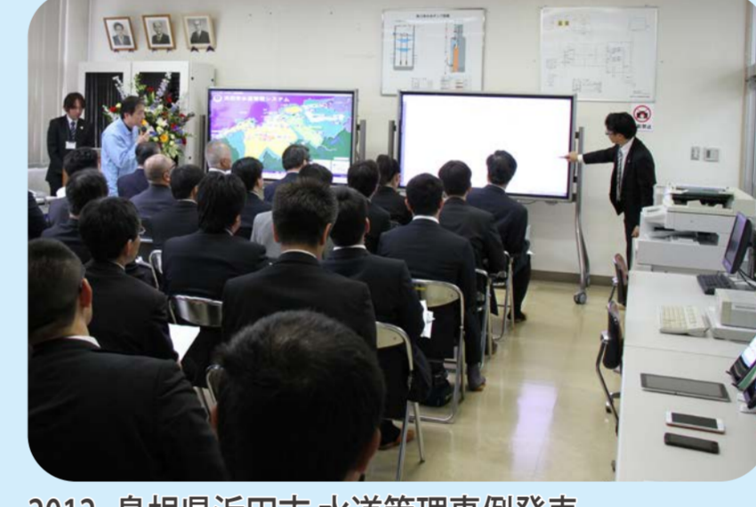
2012 島根県浜田市 水道管理事例発表