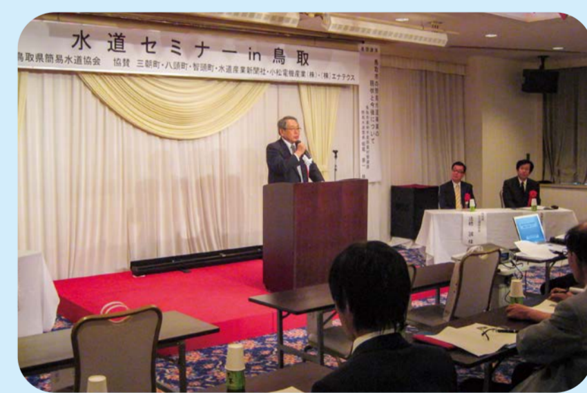
2010 鳥取県三朝町でやくも水神セミナー開催