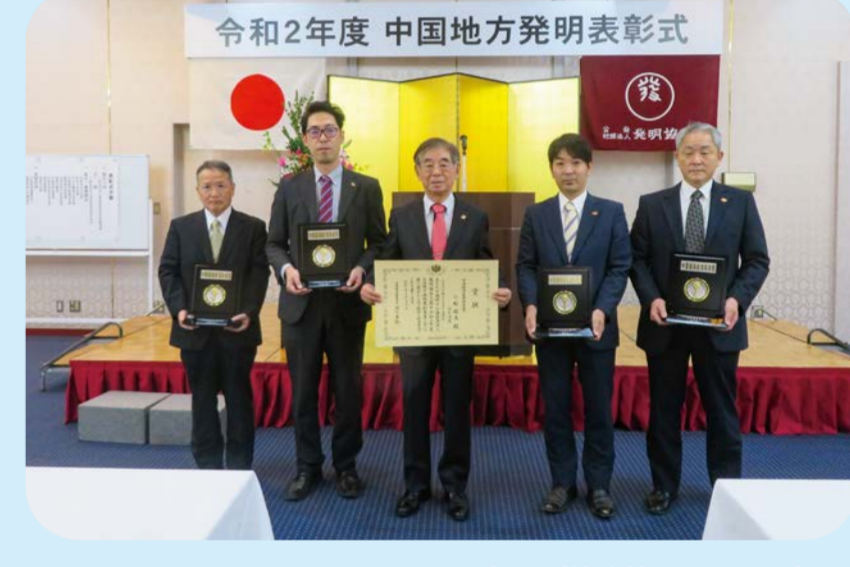
2020 クラウド型リアルタイム表示(特許第6527660号)で令和2年度中国地方発明表彰において「中国経済産業局長賞」を受賞