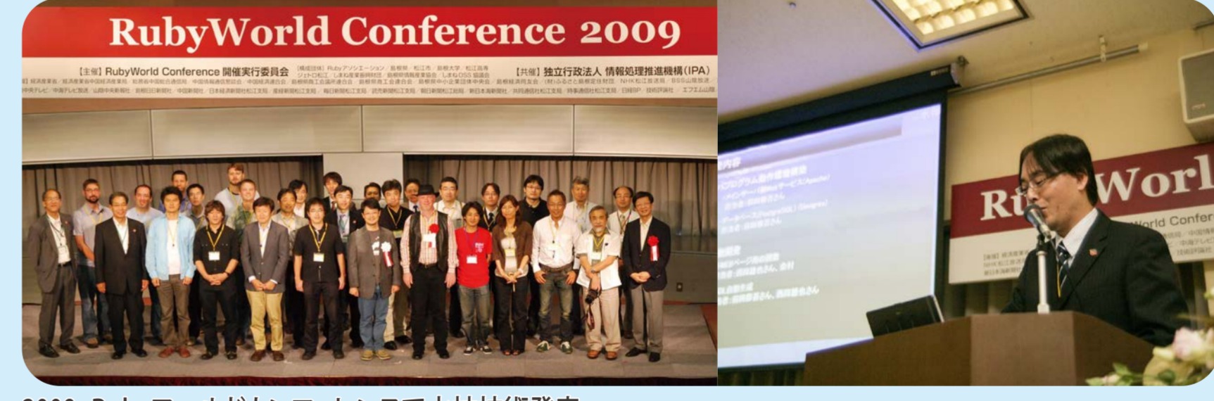
2009 Rubyワールドカンファレンスで水神技術発表