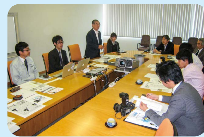
2013 リアルタイム監視システム発表