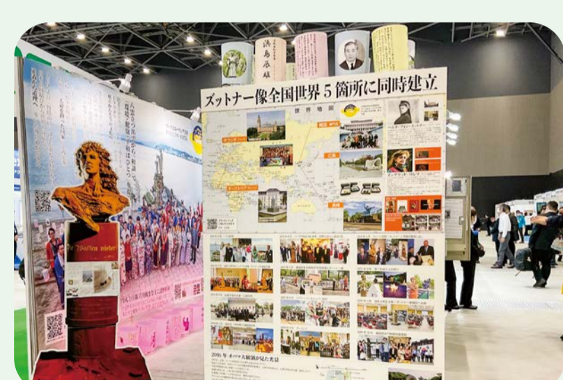
2022 東京国際物流・名古屋水道展で通信機能・手指消毒機能を有した新型を発表