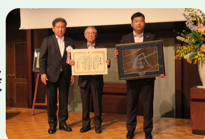
2022 中国ニュービジネス大賞優秀賞受賞