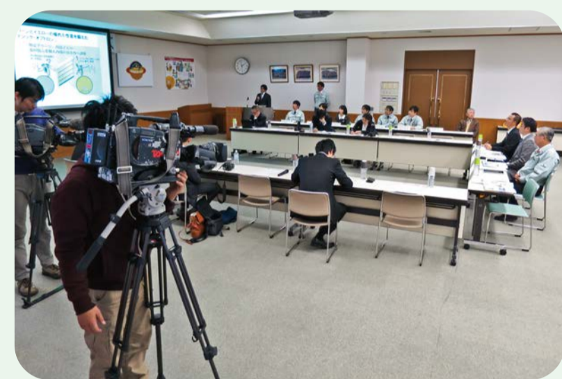
2015 マジックオプトロン門番記者発表