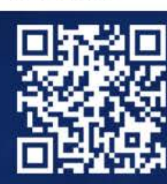
番組ホームページ