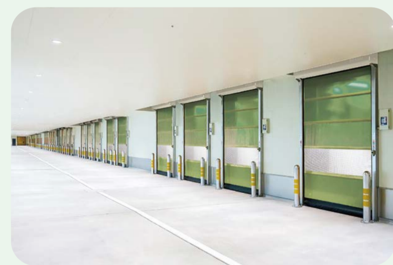
2015 豊洲新市場にマジックオプトロン150台納入