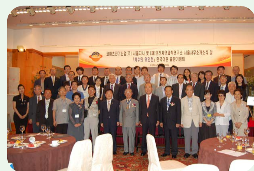
2010 韓国ソウル支社設立