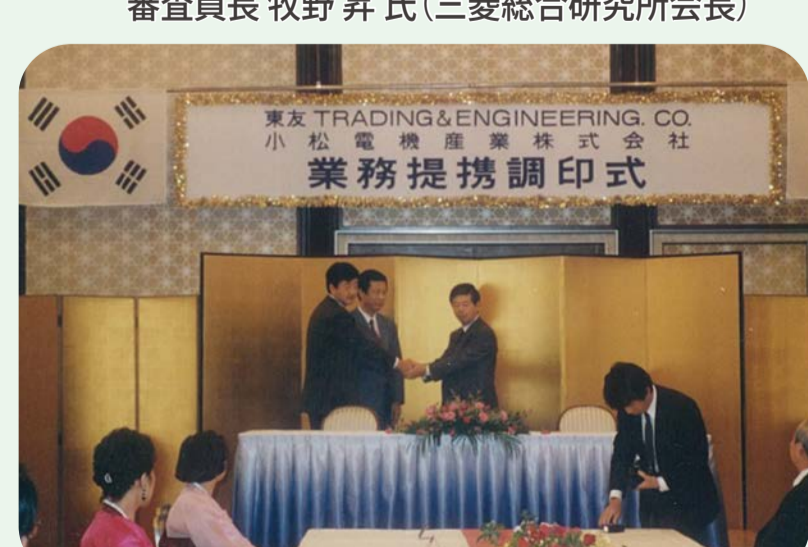
1990 韓国東友FA社と業務提携