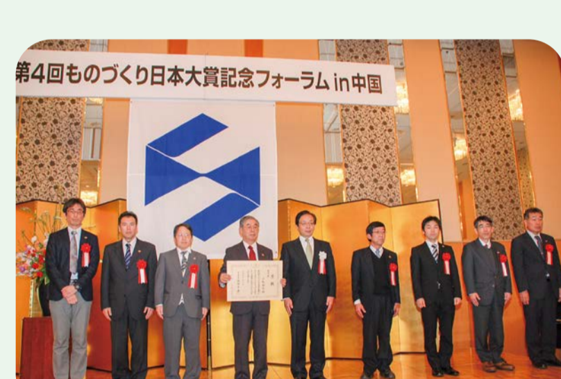
2012 ものづくり日本大賞優秀賞受賞