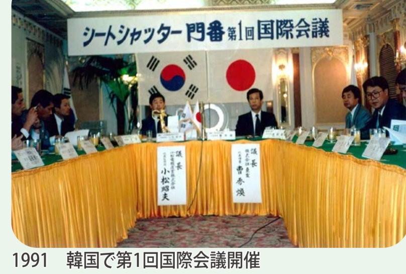
1991 韓国で第1回国際会議開催