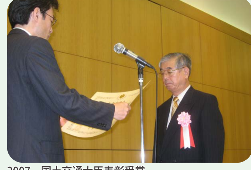
2007 国土交通大臣表彰受賞