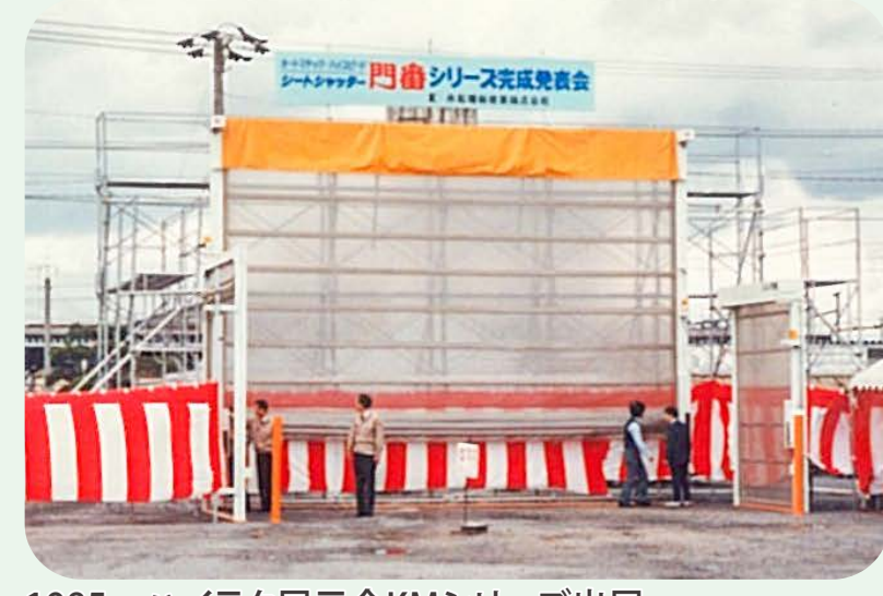
1985 ハイテック展示会KMシリーズ出展