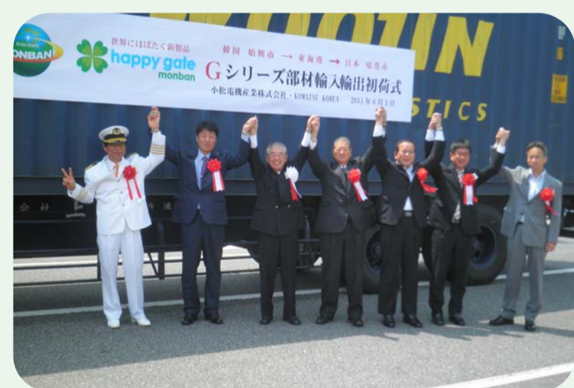
2011 境港・韓国便 輸出入開始