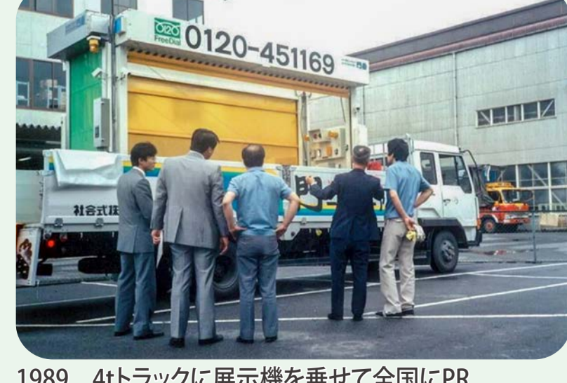
1989 4tトラックに展示機を乗せて全国にPR