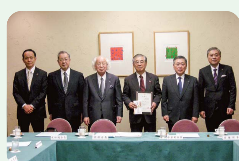
2012 シャッタードア協会より感謝状授与