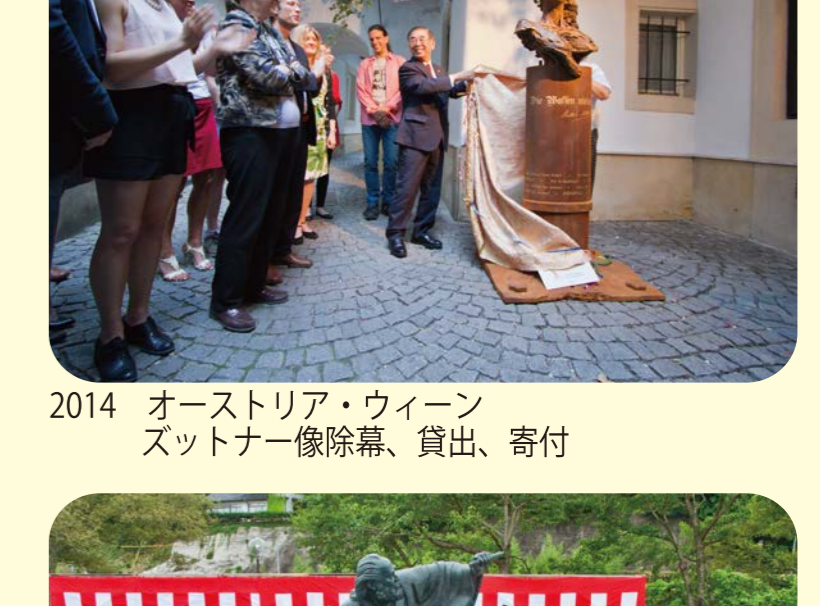
2014 オーストリア・ウィーンズットナー像除幕、貸出、寄付