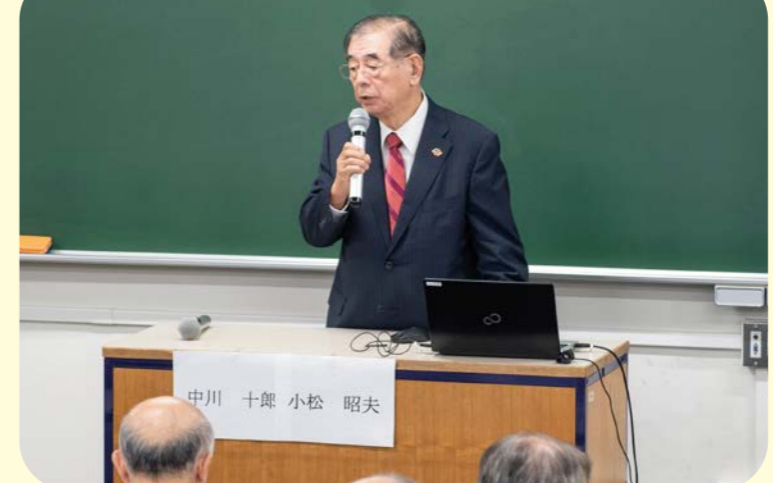
2019 国際アジア共同体学会 2019 秋季大会 岡倉天心国際賞受賞