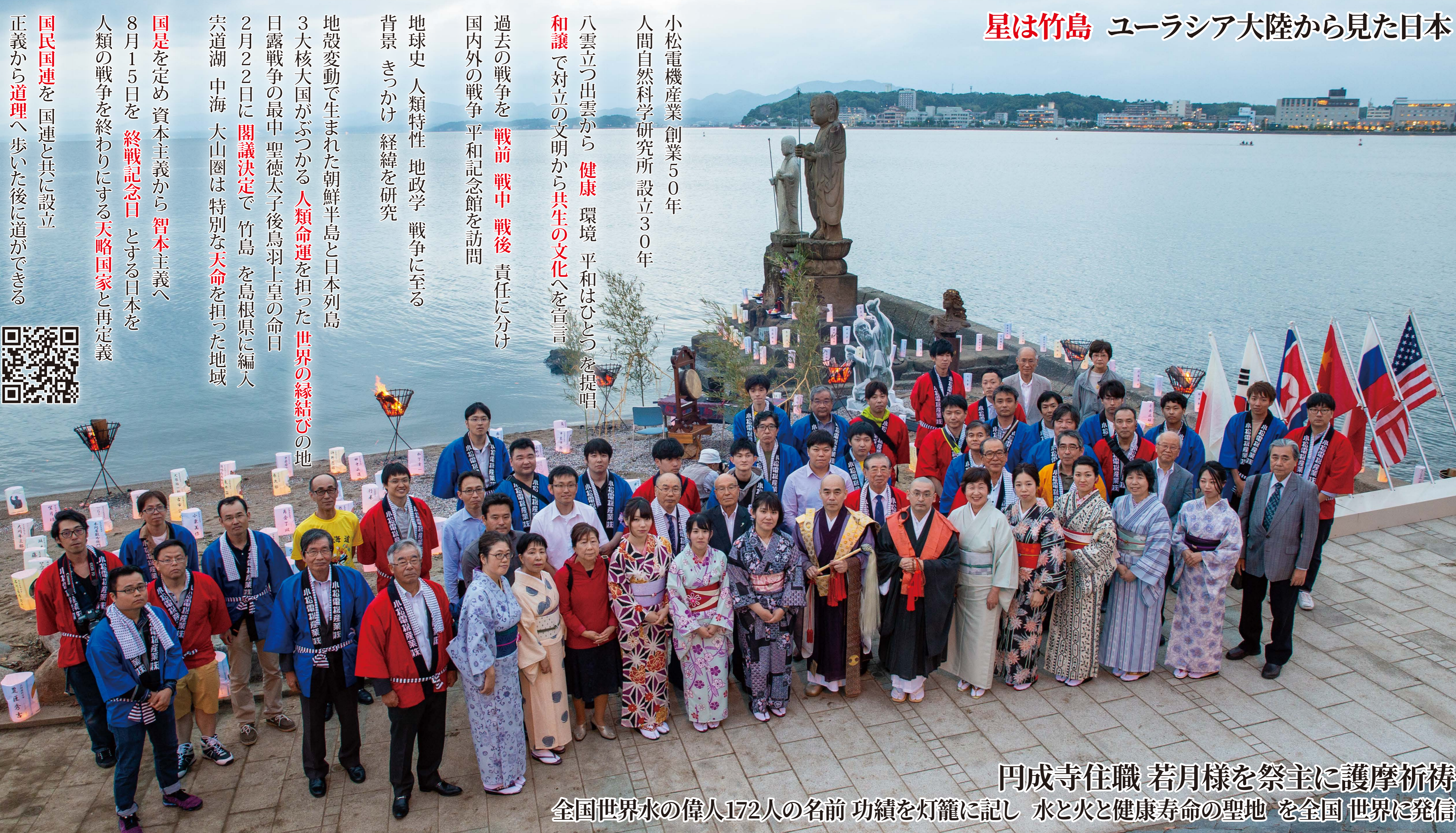
円成寺住職 若月様を祭主に護摩祈祷 全国世界水の偉人172人の名前 功績を灯籠に記し 水と火と健康寿命の聖地 を全国 世界に発信

国民国連を国連と共に設立 正義から道理へ歩いた後に道ができる 8月15日を終戦記念日とする日本を 人類の戦争を終わりにする天略国家と再定義 国是を定め資本主義から資本主義へ 地殻変動で生まれた朝鮮半島と日本列島 3大核大国がぶつかる人類命運を担った世界の緑結びの地 日露戦争の最中聖徳太子後鳥羽上皇の命日 2月22日に閣議決定で竹島を島根県に編入 六道湖 中海 大山園は特別な天命を担った地域