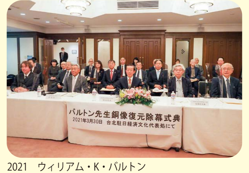
2021 ウィリアム・K・バルトン胸像復元リモート建立式典