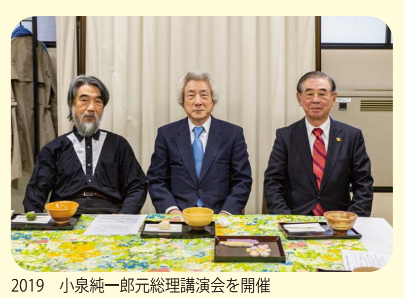
2019 小泉純一郎元総理講演会を開催