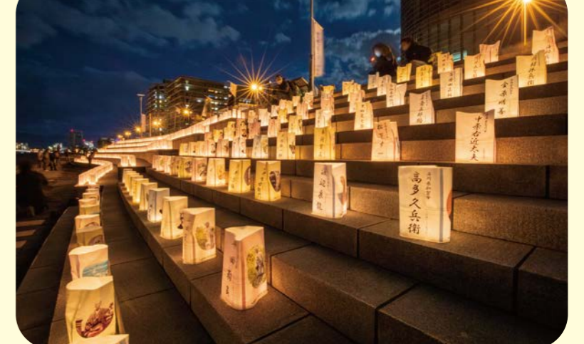
2020 六道湖岸夕陽スポット燈々島万灯会