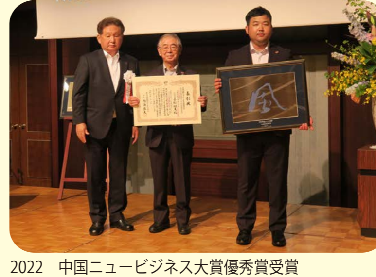
2022 中国ニュービジネス大賞優秀賞受賞