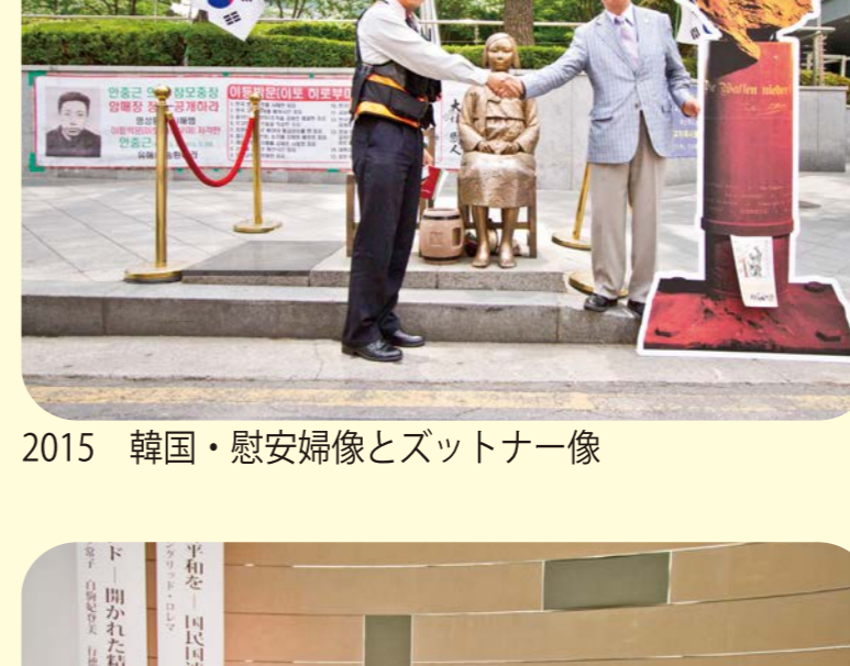
2015 韓国 慰安婦像とズットナー像