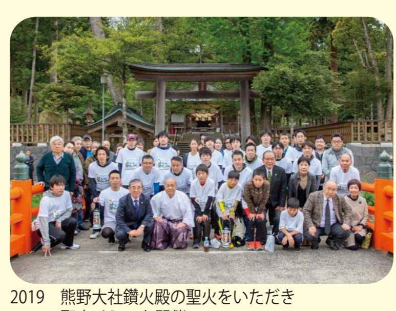
2019 熊野大社鑽火殿の聖火をいただき聖火リレーを開催