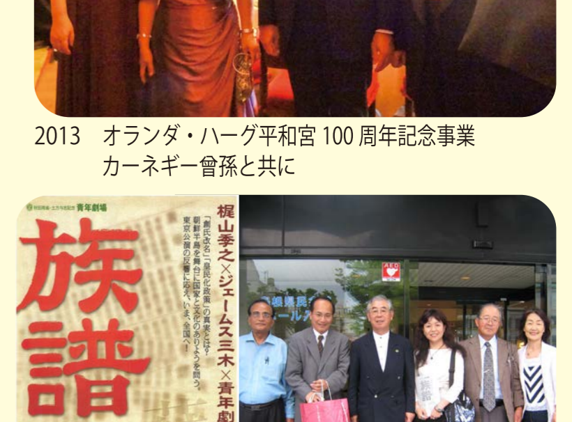
2013 オランダ・ハーグ平和宮100周年記念事業カーネギー會孫と共に