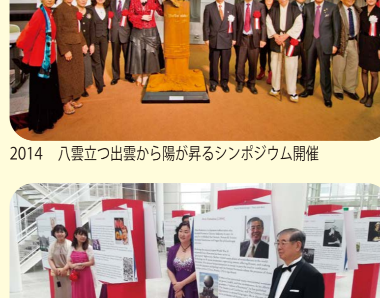
2014 八雲立つ出雲から陽が昇るシンポジウム開催