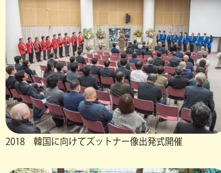
2018 韓国に向けてズットナー像出発式開催