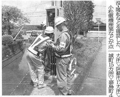
熊本県4市町内で地元代理店と合同で点検

MPの陥没・隆起など確認の発生を受け、小松電機産業(本社、松江市)、小松電機産業(本社、松江市)は、熊本市の被災地へ給水支援を行う。また、同社は北九州福岡エリアから8人が支援物資を携え、軽トラックで熊本市に入り、人的支援を行った。15日には、社員6人が岡山市上下水道局職員と一緒に応急給水活動を行った。18日には、北九州事務所から軽トラック2台、社員6人が岡山市に入り、19日には熊本市の被災地へ給水活動を行った。19日には熊本市の被災地へ給水活動を行った。19日には熊本市の被災地へ給水活動を行った。