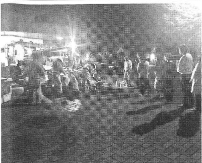
小学校で給水活動を行う第一環境の社員

熊本市上下水道局から加圧式給水車を3台派遣し、15日から熊本市の被災地へ給水活動を行っている。同社は地震発生直後から給水車の出動の準備に入り、同局の要請を受け、岡山市と古川市に配備している3・6トンの加圧式給水車2台を出動させた。15日は、夜から長瀬小学校と龍田小学校で給水活動を行い、23時50分まで給水活動を行った。16日は熊本市の被災地へ給水活動を行った。17日は熊本市の被災地へ給水活動を行った。18日は熊本市の被災地へ給水活動を行った。19日は熊本市の被災地へ給水活動を行った。