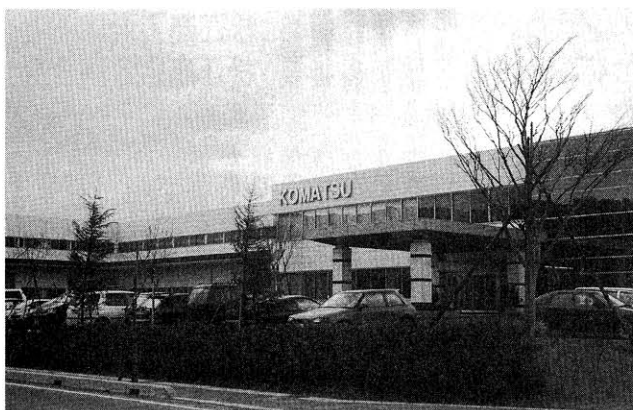
小松電機産業の新事業所