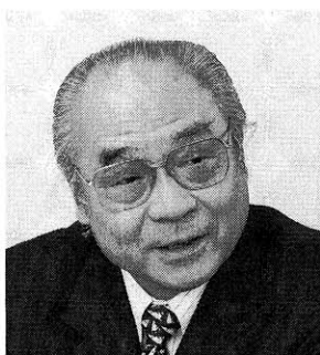
(株)販売開発研究所代表取締役