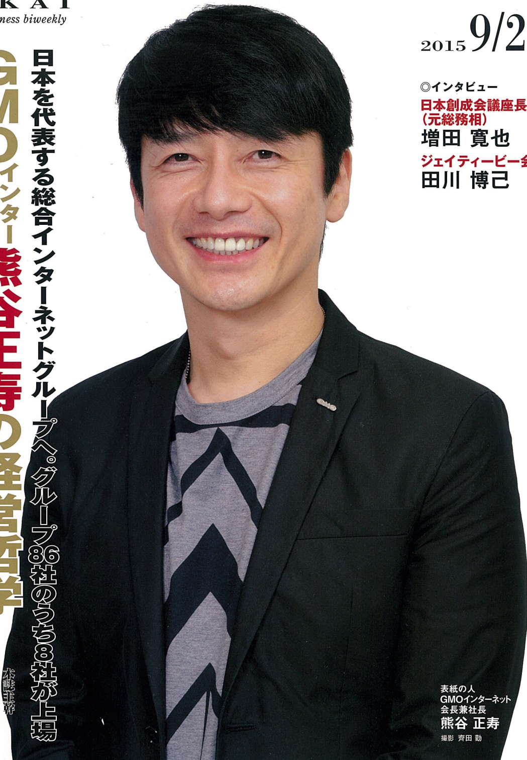
表紙の人 GMOインターネット 会長兼社長 熊谷 正寿