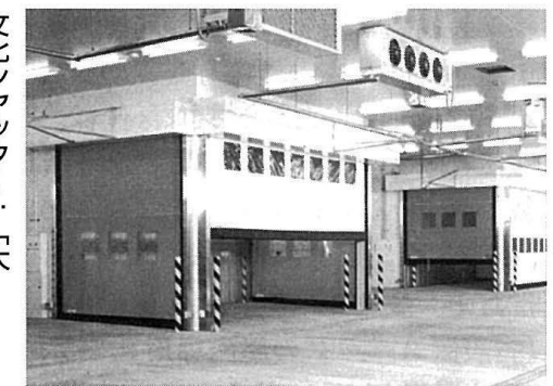
文化シャッター…「大間迅M2+M3」で、屋内に空調を保持するための区画形成に採用

◆屋内専用——「エア・キーパー大間迅ピコモ」：省スペースのコンパクト設計。出幅80.4mmから47mmにコンパクトし設置面積30%縮小。押しボタンや障害物センサをガイドレール内に、制御盤や起動センサをケース内にそれぞれ収納し、ホコリの溜まりにくいデザイン／「ミニタイプ[MINI]」／「クラシックタイプ[C]スタンダード」。