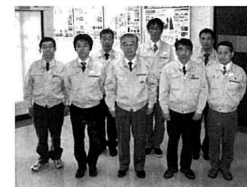
「超高速ハッピーゲート門番システム」開発スタッフ

同社は、「中小企業センター賞」「ニュービジネス大賞」を受賞した高速シートシャッター門番、科学技術庁「注目発明選定証」を受証した総合水管理シ