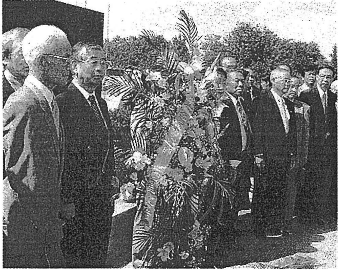
一行は台児荘大戦記念館(右)を訪れた。大戦記念行事基金百万寄付(左)