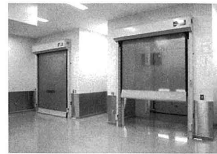
三和シャッター…製薬会社工場採用例「クイックセーバーSR」（防虫シート・明かり窓付）

「クイックセーバー」と「フレクシー」の販売比率は、売上高ベースで6対4。骨材タイプの「クイックセーバー」を主力に展開する。風速20m/秒でも動作可能な耐風圧仕様がセールポイ