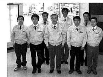
「超高速ハッピーゲート門番システム」開発スタッフ

同社は、「中小企業センター賞」「ニュービジネス大賞」を受賞した高速シートシャッター門番、科学技術庁「注目発明選定証」を受証した総合水管理シ