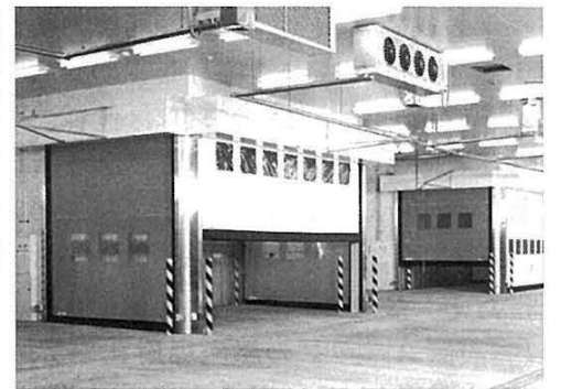
文化シャッター…「大間迅M2+M3」で、屋内に空調を保持するための区画形成に採用

【最近の動き】 パイプレスタイプの高速シートシャッターのトップブランド「エア・キーパー大間迅」。高速開閉・高気密・高耐風圧の3つがセールスポイント。独自の高気密設計でHACCP対応設備として食品関連分野を中心に浸透した。